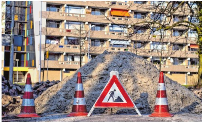
Arbeiten mit statischen oder sicherheitsrelevanten Auswirkungen sind laut Tiroler Bauordnung in den meisten Fällen bewilligungs- oder anzeigepflichtig.

www.tiroler-rak.at oder office@tiroler-rak.at